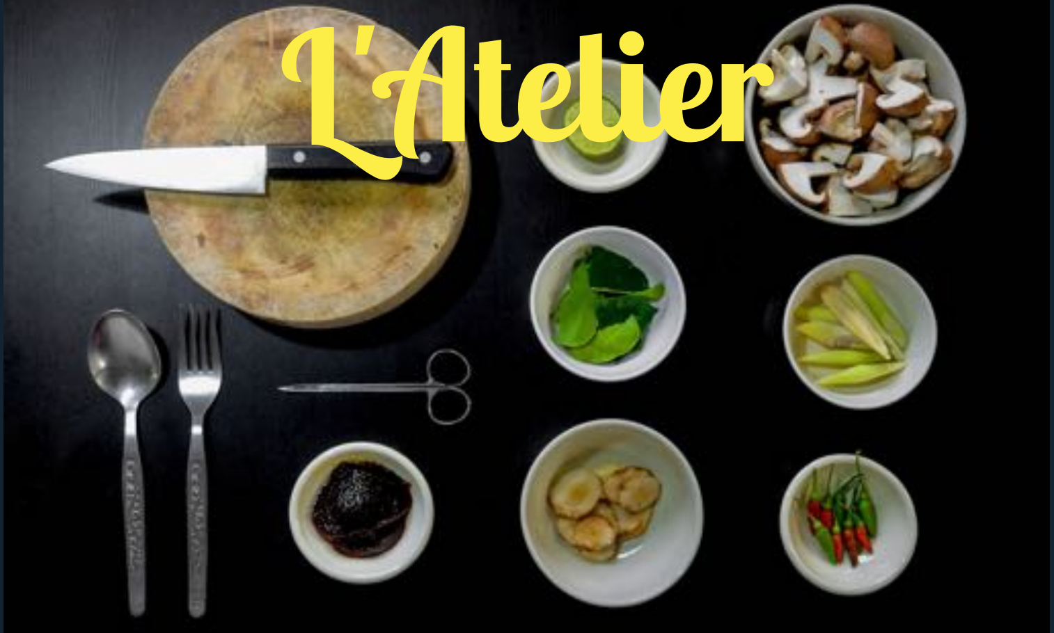
Planche Apéro : Petite 8,00€ - Grande 16,00€